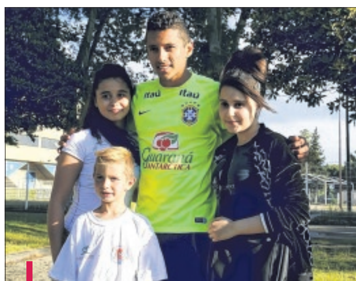
Trois jeunes supporters posent hier aux côtés de Marquinhos, la star du Brésil et du Paris Saint-Germain.