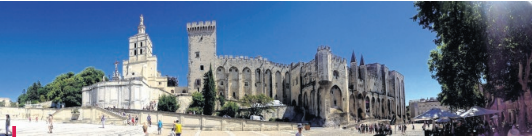
Le Palais des Papes est en compétition avec le Théâtre Antique d'Orange, le Château d'If de Marseille et la Villa Kerylos de Beaulieu-sur-mer. Vous pouvez voter pour votre monument préféré, et ce jusqu'au 16 juin, sur le site de France Télévisions. Le nom du monument préféré des français sera révélé en septembre, lors d'un prime-time

France 2 prépare une émission qui met en concurrence les plus beaux sites historiques du pays