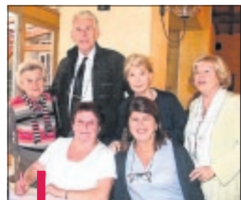
Le conseil d'administration de l'association a été reconduit.