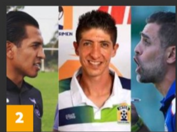
2 7 jugadores que se retiraron recientemente y se volvieron DT