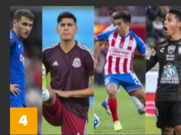
4 Los 7 llamados a consolidarse en el Clausura 2020