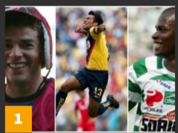
1 Los 15 peores apodos en la historia del fútbol mexicano