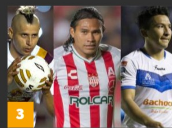
3 15 Jugadores que intentaron volver desde el Ascenso MX